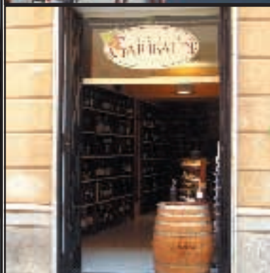
Nella foto grande e nella prima in alto il monumento incompiuto a Garibaldi. Le altre immagini testimoniano il «merchandising» legato all'eroe dei due mondi a Marsala

vincia di Catania, la città delle incompiute, tengono anche un festival ( www.incompiutosiciliano.org ). Quella che propongono è un'iniziativa di denuncia associata a una riflessione sul paesaggio, certamente, ma sono proprio convinti che l'incompiuto sia uno stile, anzi, lo stile italiano. Vogliono dare dignità a queste opere interrotte. Senza completarle, ovviamente. Passandole in rassegna, come hanno fatto, in processione, fino alla Biennale di Architettura di Venezia. Un altro viaggio dell'unità.